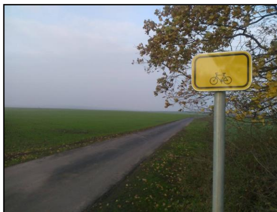
Cyklotrasa Nový Poddvorov – Moravský Žižkov (před realizací a po realizaci)

Oba zmiňované projekty byly realizovány pod záštitou Mikroregionu Hodonínsko – dobrovolného svazku obcí. Finančně byl projekt „ Tradiční místo odpočívku našich předků; populární cykloodpočívka při obecní studni, II. etapa “ podpořen Jihomoravským krajem a obcemi Mikulčice a Průšánky. Investiční projekt na výstavbu I. etapy cyklotrasy Nový Poddvorov – Moravský Žižkov , byl finančně podpořen také Jihomoravským krajem a obcemi Průšánky, Moravský Žižkov, Čejkovice a Nový Poddvorov.