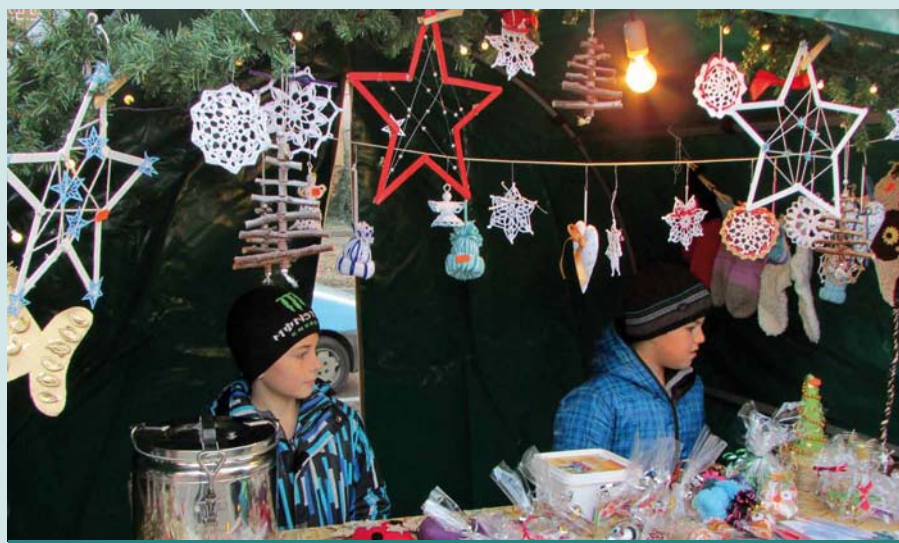
Mikulášský jarmark v Kosticích