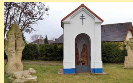
Sochy u Kapličky s Ježíškem, Marií a Josefem