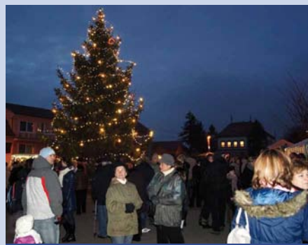
Rozsvícení vánočního stromu

Na sv. Štěpána večer mívá obecní výbor schůzi, v níž volí se policajt, hotaři, ponocný a pastýř. Vedle obecních služebníků ustanovuje v ten den obecní výbor obecní žebráky.