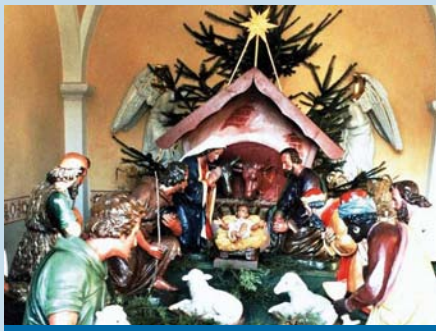
Část betlému v kapli

Celý Štědrý den byl přípravou na Štědrý večer. A byl přísně postní. Bylo dovoleno jen napít se černé kávy. Pověra varovala před „perechtou“ a jejím dřevěným nože, který by mohl „rozpárát“ neposlušné břicho. Celé Vánoce dominovala stolu symbolická ošatka se vším obilím, klasy, cibulí, česnekem, petrželí a mrkví. Štědrovečerní večeře byla skromná, možno říci chudobná. Před večeří se podávaly obřadně oplatky, které pekli starší manželé Přívozni. Večeře dříve – oproti dnešní - byla velmi jednoduchá. Podávala se polévka s obsahem „každé stravy trošku“, polévka fazulačka