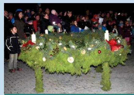
První společný adventní věnec v r. 2014

Boží hod probíhá klidně, všichni většinou navštěvují svou rodinu nebo naopak návštěvy přijímají.