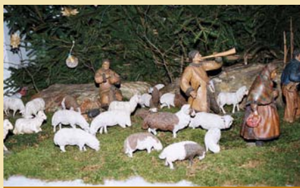
Jako první se přišli poklonit pastevci se svými stády

Jednou z forem této přípravy je návštěvování ranních adventních mší, takzvaných rorátů. Mše začíná v úplné tmě, kterou za zpěvu adventní písně „Ejhle, Hospodin přijde“ prozáří spousta drobných světýlek svíček, které mají děti v lucerničkách nebo v rukou. Průvod dětí přinese světýlka až k oltáři, kde od nich kněz sloužící mši zapálí svíce na oltáři. Poté už se rozsvítí všechna světla v kostele. Tyto mše berou děti velmi vážně. Každou mši v týdnu má na starost jedna třída ze Základní školy, která světýlka přináší. Vždy dětí dost, aby zaplnily přední lavice v kostele. Za tyto návštěvy rorátů pak bývají odměněny hvězdičkami, které si vlepují do archu a ti nejpoctivější budou po Vánocích za své úsilí odměněni nocí se zajímavým programem na faře. Některý rok zase děti za návštěvy rorátů dostávají stužky, kterými pak zdobí vánoční strom v kostele. Je velmi příjemné začít den návště-