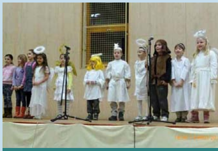
3. adventní neděle 2015, vystoupení žáků ZŠ

ho osvětlení a nazdobený smrk u kostela. Mikuláš, čerti a andělé přijíždějí na povozu taženém koňmi, nebo vyjdou z kostela, popřípadě přijdou z obecního úřadu. Žáci školy si připraví krátké kulturní vystoupení a pod stroměčkem probíhá malý mikulášský jarmark s výrobky našich šikovných spoluobčanů a školních dětí. Od Mikuláše dostane každé dítě za básničku nebo písničku balíček se sladkostmi. Při čaji nebo svařeném víně si všichni můžou zazpívat s Lan-