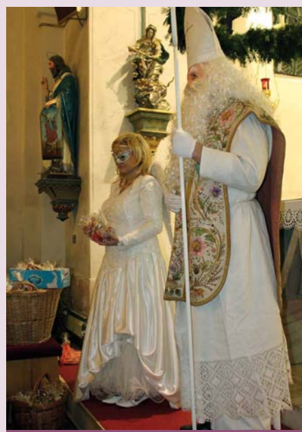
Mikuláš s andělem v kostele

VÁNOCE jsou svátky, které očekávají hlavně děti. V dnešní době jsou stále více zneužívány komerčí, ale z doby minulé zůstalo několik zvyků, některé zaniklé se v poslední době obnovují, např. děti ze školy chodí zahalené jako Luciky /nebo matičky/vymetat nemoci a nepravosti. V předvánočním čase mají dílničky a chystají perníčky, ozdoby, svícný apod. Všeobecně je oblíbený předvečer svátku sv. Mikuláše, i když se za čerty, anděla a Mikuláše převlékají stále mladší děti. Mikuláši dříve navštěvovali i svobodná děvčata, děti obdarovali sušeným ovocem, ořechy. Ty věřily, že se čerti spouštějí na provaze u boží muky, které stávaly v polích nad Týncem. Také si dávaly za okno čepice, aby do nich dostaly něco dobrého. V dnešní době se pořádá mikulášská nadílka v kostele pro všechny děti, které přijdou.