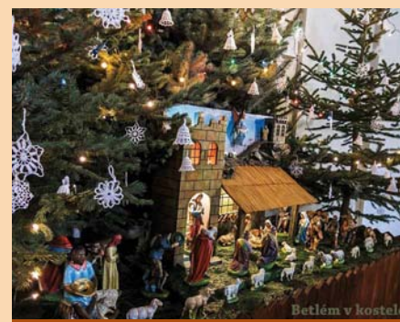
Betlém v kostele

rách před otevřeným sklepem, byli tam šohaji a děvčata v kroji a hlavně vyřezané figurky lidí, kteří nikdy do kostela nechodili, ale které by tam pan farář zřejmě rád viděl. V roce 1982 byl tento betlém poprvé vystaven v kostele, ale s dobrou odezvou se nesetkal. Místním babičkám se nelíbil – „Ježíšek že sa narodil v Nechorách mezi ožralcama?! A co ty figurky? Takoví zašknůření pajáci! A proč sú v betlémě zrovna tito bezvřerci?!“ Farář to hodně mrzelo a už nikdy betlém nevystavil. Nějakou dobu byl betlém uložen