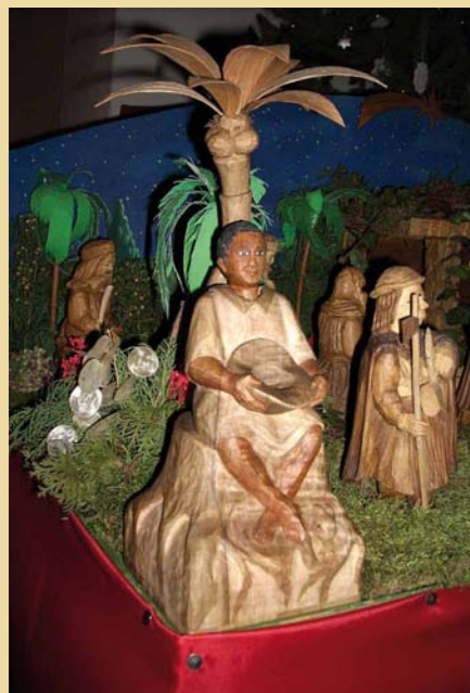
Černouška vyřezal ze dřeva Martin Lekavý