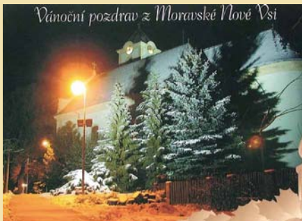
Pohlednice s vánočním motivem

Jen se začalo na Štědrý den stmívat, do dědiny vyrazili koledníci. Většinou se chodilo po rodině nebo známých, ale bylo i dost takových, kteří to brali „dům od domu“. Do košíčku dostávali ovoce, pečené cukroví, nejvíce je potěšila nějaká ta korunka. To bylo radosti! Koledníků bývala plná dědina a do zpěvu překrásných koled přídali i starší rachejtě, petardy a také světlice. Byl to nádherný koncert pod širým nebem. Dědina byla pokryta sněhem, venku poblíkávala světélka, doma praskalo v kamnech a ještě někde v nejstarších domech i v peci, povídalo se dlouho do noci. Byla to nenapodobitelná atmosféra.