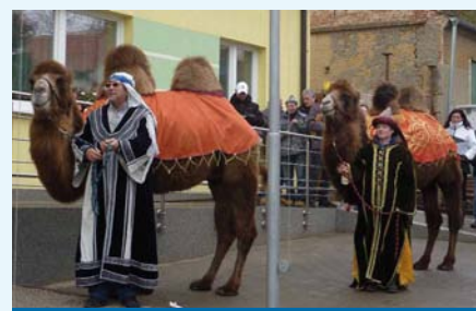
Tříkrálová sbírka v roce 2014