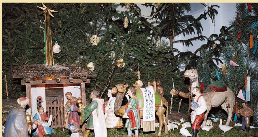
Na svátek Zjevení Páně přibude k jesličkám karavana s mudrci

jiné, připravám vánočních výzdob svých domovů. Jinak tomu není ani v kostele sv. Václava. Zde farníci po posledních rorátech 24. prosince vyzdobí kostel živými vánočními stromky v prostoru kostelní lodi i presbitáře, které jsou ozdobeny skromně a vkusně vpadajícími slaměnými ozdobami. Součástí výzdoby je i Betlém, který má v kostele v době vánoční své místo. Ten chodí lidé, zejména děti, obdivovat, kochat se jím a poklonit se jeho prostřednictvím narozenému Kristu.