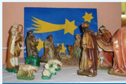
Nejstarší betlém má škola