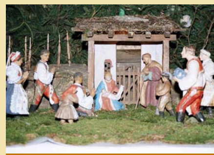
Samotné jesličky se svatou rodinou

Podklad na kterém jsou jesličky vystaveny tvoří mechové podložky. Mech musí v době adventní v lese posbírat ministranti, kteří mají v lese v rámci tohoto sběru vlastní program, který pro ně sestaví starší vedoucí. Takový podklad je pak ještě dozdoben větvíčkami ze stromků a osazen jesličkami a figurkami svaté rodiny a prostých lidí, oblečených ve všedních i slavnostních krojích, kteří jsou svědky radostné události narození Spasitele. Na svátek Zjevení Páně (6.1.) ještě přibude karavana s mudrci z dálného východu, která mimo služebnictvo čítá i zvířata - velbloudy a slona. Toto umělecké dílo je pak v kostele vystaveno ještě nějakou dobu po konci doby vánoční.