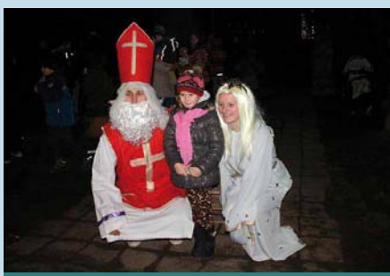
Mikuláš a anděl v Ladné v r. 2015

Mikuláš přijde i v Ladné pokaždé dne 5. prosince. Tento den se poprvé rozsvítí vánoční hvězdy na sloupech veřejné-