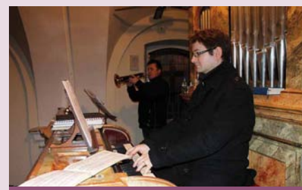
Vánoční koncert v kostele