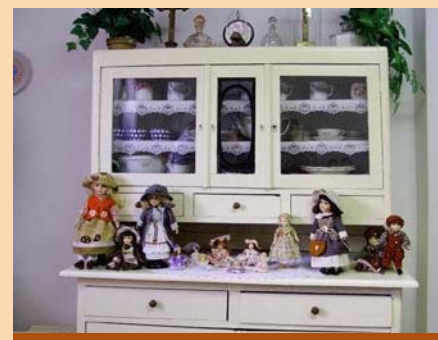
Výstava keramických panenek