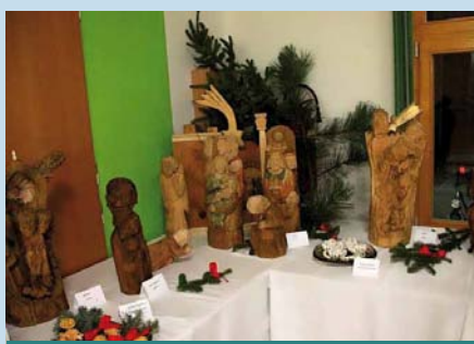
Výstava vyřezávaných betlémů

Za začátek „vánočního času“ v naší obci můžeme považovat první adventní neděli. Letos se již potřetí sejdeme u velkého adventního věnce instalovaného venku před sportovní halou, abychom se potěšili nejenom ze setkání s našimi přáteli, sousedy, rodinou, ale abychom se také zaposlouchali do písní mužáckého sboru Lanštorfčané. Letošní první adventní neděle bude opět