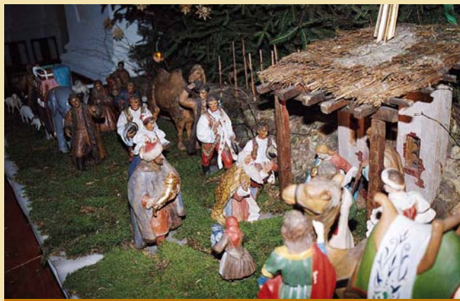
Pohled na Betlém může být vskutku impozantní

vou rorátů a pohledem na ty rozveselené, leč někdy unavené dětské tvářičky. Konec adventu pak lidé věnují, mimo