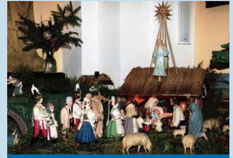
Část lidového betlému