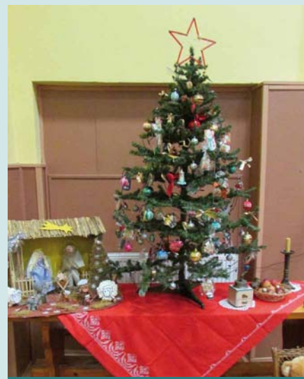
Výzdoba na vánočním zpívání

Dnes u nás v Kosticích začíná čas vánoční vánoční výzdobou nejen osvětlením v obci, ale i občané mají v oknech krásné vánoční dekorace, někdy také u domu a v předzahrádkách. Ve znamení předvánoční atmosféry se koná Mikulášský jarmark, za účasti široké veřejnosti je rozsvícen v parku uprostřed obce