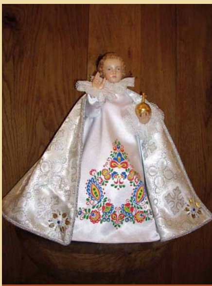
Tzv. Pražské jezulátko v kostele

V dnešní uspěchané době to však někteří lidé nevládají. Hlavní je pro ně úklid domácnosti, nakupování velkého množství potravin, shánění drahých dárek pro své nejbližší, obchodní řetězce praskají ve švech a to vše má za následek velkou nervozitu. Mnozí si pak stěžují, že vánoce jsou nejhorší a nejdražší svátky roku. Ale proč? Vždyť Vánoce jsou právě ty NEJKRÁSNEJŠÍ svátky roku. Mnohé děti nepotřebují ty