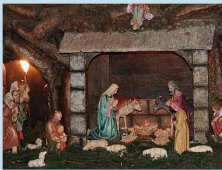
Betlém v kostele

nebo Novoroční koncert, na které si zve obec hudební tělesa, která zde předvedou své umění. Letos je pořádán Novoroční koncert 7. ledna 2017 v 17.00 hod.