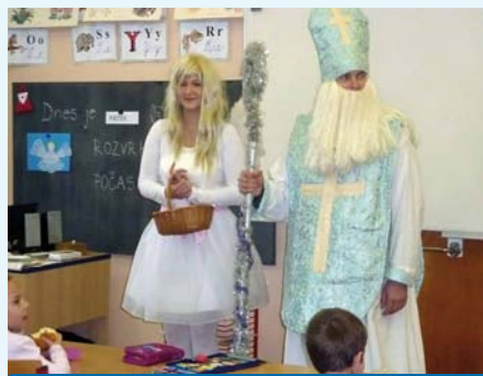
Mikuláš s andělem přišli do školy

Vánoční čas ve Starém Poddvorově Blíží se nejkrásnější svátky v roce – Vánoce. V naší obci je začínáme vždy první adventní nedělí, kdy se sejdeme u základní školy, abychom slavnostně rozsvítili obecní vánoční stromek. O program se starají žáci základní a mateřské školy. Pro děti jsou připraveny létající lampiónky, kam mohou našeptat svá vánoční přání a poslat je do nebe Ježíškovi, dospělí si pochutnají na vánočním punči. Tradicí se stala také adventní besídka v kulturním domě, kde obyvatelé obce mohou zhlédnout vánoční pohádku v podání žáků základní školy.