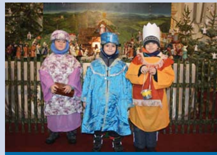
Tři králové v kostele