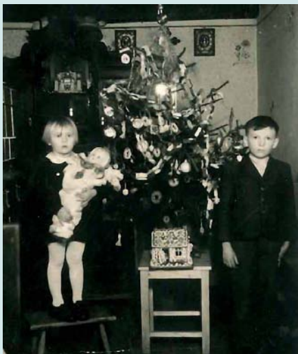
Vánoce v roce 1945

Vánoční svátky jsou nejkrásnější svátky v roce a i když hodně tradic se nemění v porovnání s minulostí je zde rozdíl. Nejdříve vzpomenu jaké bývaly tyto krásné svátky za mého mládí.