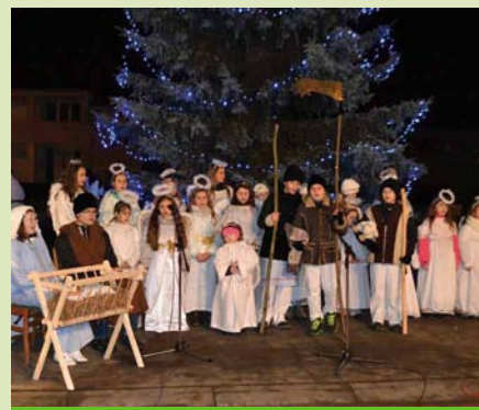
Vánoční zpívání - DFS Žižkovjánek