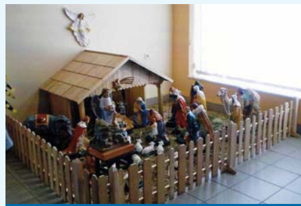
Betlém z kostela sv. Martina

A již jsou tu ty vytoužené svátky klidu, míru a pokoje. Pro věřící obyvatele jsou spojeny s církevními aktivitami v kostele: 24. prosince – Štědrý den je v kostele sv. Martina sloužena „půlnoční mše svatá“ ve 21.00 hodin, 25. prosince – Slavnost Narození Páně a 26. prosince – Svátek