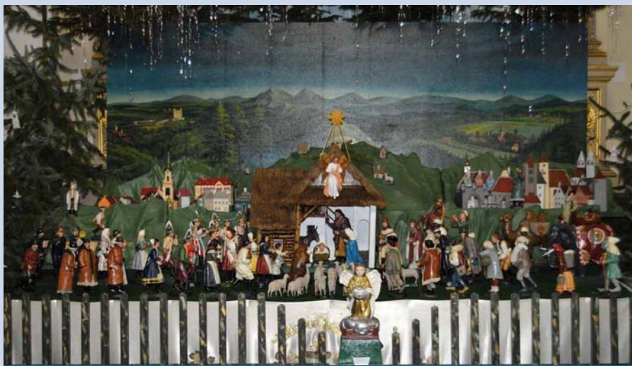
Betlém v kostele

Tradici živých betlémů začala v roce 2002 mateřská škola. Učitelky s dětmi každý rok nacvičují živý betlém, se kterým děti vystupují zpravidla 25. 12. v odpoledních hodinách v prostoru náměstí, někdy na dvoře mateřské školy.