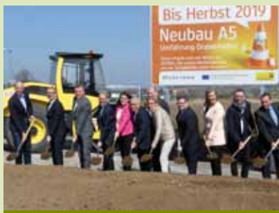
Drasenhofen, zahájení stavby obchvatu

V tomto silničním úseku se investuje kolem 50 miliónů euro. Začátek tvoří zemní stavební práce, přesune se milión kubických metrů země a zbuduje celkem 8 mostů.