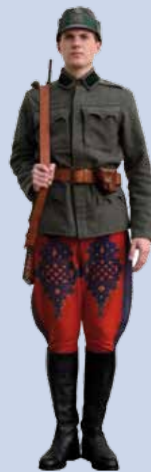
Rekonstrukce stejnokroje Slovácké brigády vycházejícího z podlužáckého kroje