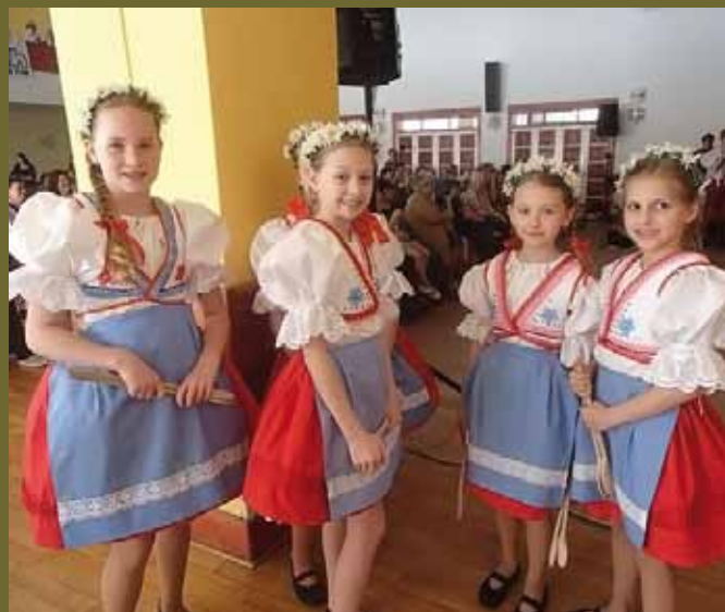
Zpěváček Podluží - Starý Poddvorov