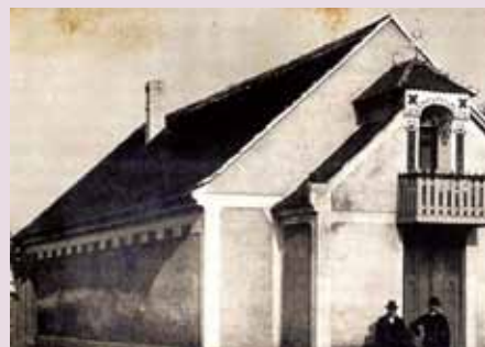
Sokolovna v Týnci dříve...

Připravila: Věroslava Hesová