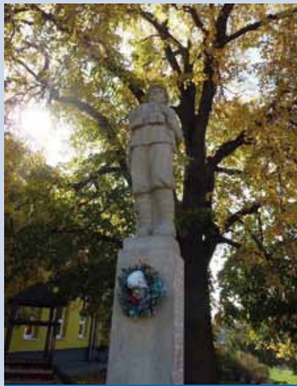
Pomník u školy na památku padlých