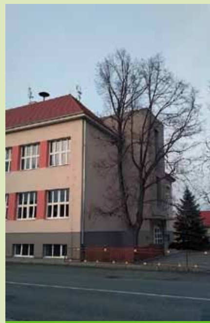
Lípa Svobody před budovou Základní školy T. G. Masaryka v Moravském Žižkově