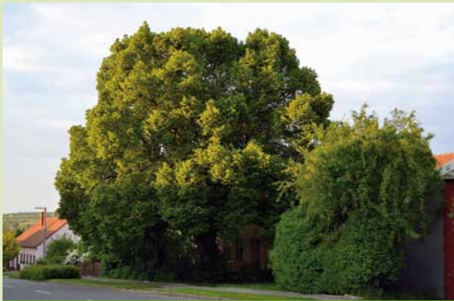
Lípy svobody před obecní nemocnicí

V pátek 25. dubna 1919 se v Moravském Žižkově konala na počest nově vzniklé československé republiky slavnost Sázení stromů svobody. Ve dvě odpoledne vyšel za zpěvu po-