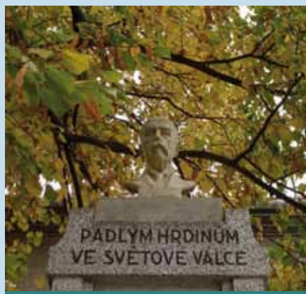
Nápis na opraveném pomníku

Pomník je památkou na třicet osm lidenských občanů, kteří se nevrátili z bojů I. světové války.