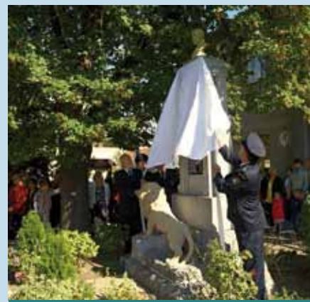
Slavnostní odhalení pomníku

Pomník měl původně stát v kostelní zahradě, po zamítnutí z vyšších církevních míst bylo vybráno místo před budovou školy. Pomník byl slavnostně odhalen 28. října 1931.