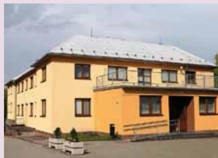
... a dnes