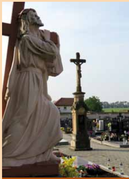
Památník padlých v 1. světové válce na místním hřbitově

Legionáři byli jistým trumfem v rukou T. G. Masaryka ve snaze etablovat vznikající Československou republiku. Ukázal, že sice neexistuje Československo, ale už má své vlastní vojenské jednotky. Po vzniku Československa představovali naši legionáři ve společnosti jistou elitu a tvořili i oporu nového státu. Nejprve se vraceli legionáři ze Západu, pak ti ruští. Po pádu carské říše totiž neměly ruské legie žádnou jistotu, co s nimi bude. Západní cestou se vrátit domů nemohly, a tak jediná cesta vedla na východ, přes Si-