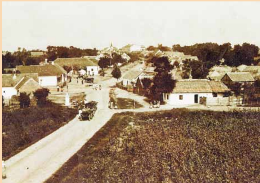
Hrušky v první polovině 20. století