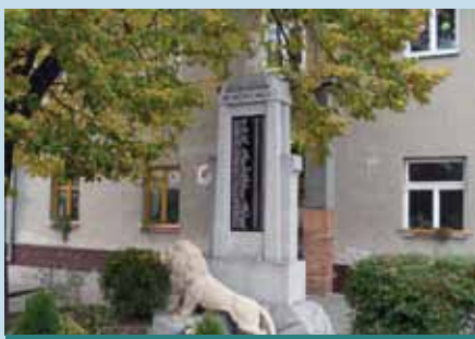
Opravený pomník v Ladné

Dle místní kroniky byla zpráva o vzniku samostatného Československého státu přijata s obavami z následujících persekucí. Po převzetí c.k. úřadů Národními výbory, byl konec všem obavám. Občané byli vyzváni, aby si zvolili Národní výbor a Hospodářskou radu. V Lanštorfě bylo zvoleno 9 členů, kteří půso-