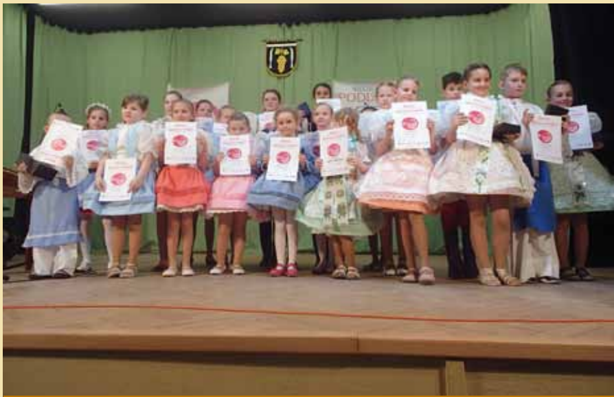
VII. ročník soutěže dětských zpěváků Regionu Podluží ve Starém Poddvorově

Také letos se konal v Lanžhotě U Bartošů mezi-obecní turnaj v kuželnách. Semifinálová kola proběhla ve dnech 20. až 21.2.2018, během kterých postoupilo do celkového finále 6 čtyřčlenných družstev s nejvyšším skóre. Družstva z obcí Ladaná a Josefov se omluvila z důvodu nemoci. Po napínavém večeru