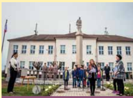
Pietní akt při příležitosti 73. výročí osvobození obce Lužice

Památný rok 2018 jsme zahájili na Starém kvartýru besedou „Nahodilá armáda“ o Československých legionářích s historikem F. Trávníčkem. Při pietním aktu k osvobození obce RA v r. 1945 vysadili žáci ZŠ lípu svobody u památníku osvobození před školou. Další sedm lip vysadili členové spolků při brigádě ke Dni Země 21. dubna.