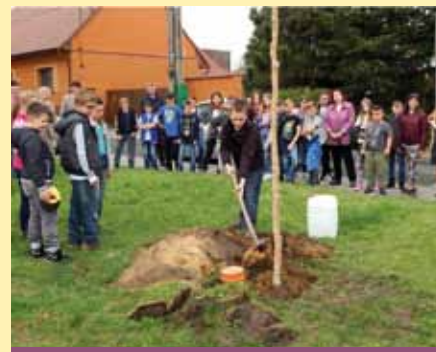
Vysazení Lípy svobody