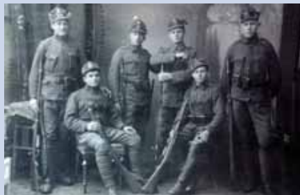
Vojáci Slovácké brigády v upravených rakousko-uherských stejnokrojích ozbrojenými puškami Mannlicher, přelom 1918/1919