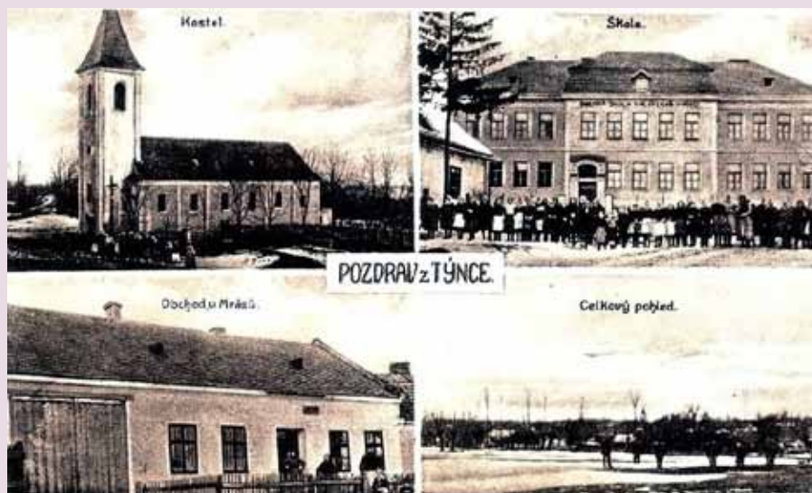
Pohlednice se čtyřmi záběry z obce z 1. pol. 20. století

1924 – vybudována státní silnice od radnice kolem kostela ke stávající silnici, v dalších letech byly postupně budo-