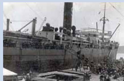
Nalodění legionářů ve Vladivostoku