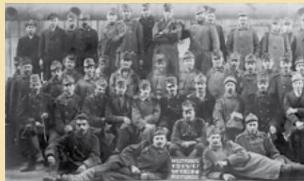
Pěší vídeňský regiment - i zde sloužili bojanovští rodáci

„Dne 22. března (1917) ráno jsme přijeli co Čelkaru (Kazachstán pozn. redakce) a když jsme tam jeli, tak jsme jeli podél Aralského moře, bylo zamrzlé a plachetní