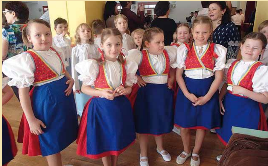
XIV. ročník přehlídky dětských folklorních souborů v Mikulčicích