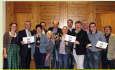
Poysdorf präsentiert seinen Stadtwein

Bei den Weißweinen ist der Sieger für 2018 ein Grüner Veltliner, Weinviertel DAC aus dem Weingut Kalser. Bei den Rotweinen wurde der Zweigelt vom Weingut Neustifter zum Stadtwein 2018 gekürt. Der Stadtfrizzante kommt aus dem Weingut Hirtl und bei den Sekten hatte das Weingut Heinz Heger die Nase vorn.