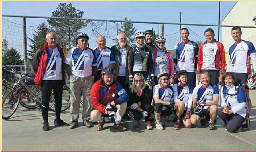
XV. ročník tradičního „Otvírání jara na Podluží a Hodonínsku“