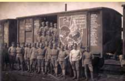
Čsl. legionáři vracující se z Ruska

Zpráva o „převratu“ z 28. října 1918 došla do zdejší obce až druhý den. Přinesli ji lidé z Hodonína. Za chvíli již o tom