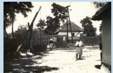
Mikulčice V kopci