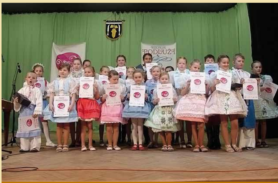
Zpěváček Podluží - děti soutěžily tradičně ve třech věkových kategoriích