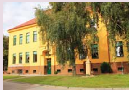
Současná budova školy

1930 - asi 10 studentů poprvé jezdilo na gymnázium do Hodonína, na vysoké škole nestudoval nikdo. V r. 1931 začali někteří chodit na měšťanku do Moravské Nové Vsi, ostatní zůstali ve škole v obci. V roce 1938 měla škola 143