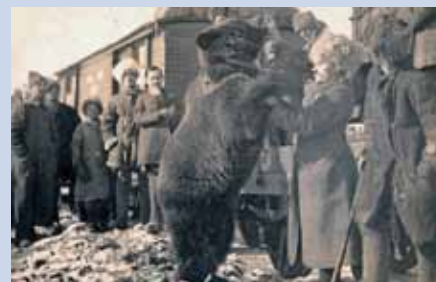
Legiovlak – návrat domů