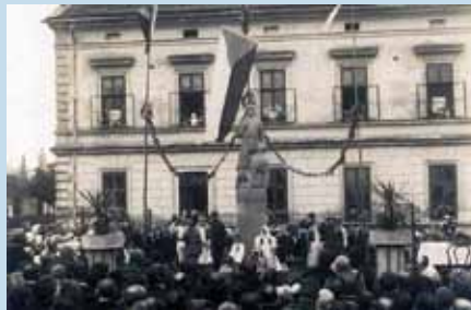
Odhalení pomníku padlým

staven ve školní zahradě pomník nesoucí jejich jména. Byl odhalen 2. listopadu 1930 za velké účasti občanů. Po proslověch, básních, fanfárách z Libuše a dalších písních bylo vypáleno 47 ran z pušek (stejný počet jako počet padlých). Pomník byl zhotoven za 14 000,- Kč dle návrhu prof. K. Poláka z Jevíčka.