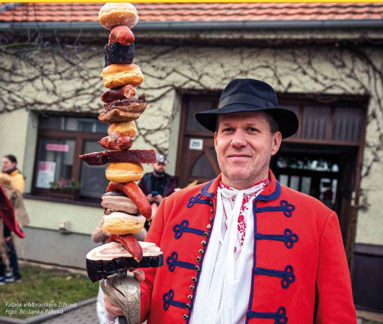
Fašáň v Moravském Žižkově