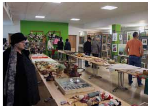
Výstava ručních prací a sběratelských činností občanů obce Ladná

Klub seniorů Ladná uspořádal ve dnech 25. až 26. 2. 2023 výstavu ručních prací a sběratelské činnosti v místní sportovní hala. K vidění byly sbírky panenek, minerálů, historických zbraní, krojových doplňků a dalších věcí. Dále zde byly vystaveny obrazy, fotografie, modely vozidel a lodí, paličkováné ornamenty, malovaná vajíčka, ale také