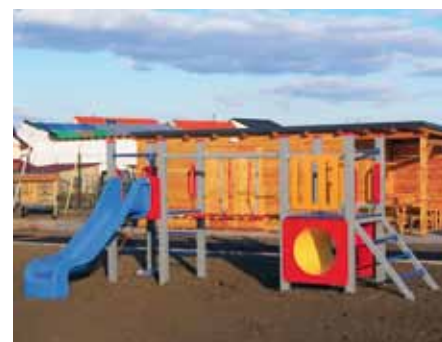
Zahrada her se těší na své návštěvníky

Ve vzdělávací části budou umístěny např. vyvýšené záhony, nádoba na zadržování dešťové vody, kompostér a ovocné dřeviny. Děti tam mohou pozorovat zákonitosti přírodních dějů a mnohému se naučit. V zahradě her budou umístěny jednotlivé herní prvky a prvky mobiliáře, po chodíčkách mohou děti jezdit na koloběžkách nebo pobíhat, v další části se mohou věnovat kreslení na kreslicích tabulích. Přírodní kout by měl navozovat atmosféru lesíku, povzbuzovat děti k vynalézavosti a kreativitě. Terén v této části bude modulován, vytvoří se valy, které budou sloužit k pobíhání, sklouznutí na skluzavce nebo po nich děti „vyšplhají“ na kopec. Pokud bude sníh, mohou děti bobovat nebo sáňkovat.