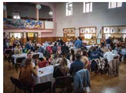
Zájem o velikonoční food-market byl velký

Naše země za poslední dobu vystřelila v úrovni gastronomie o několik světelných let. Restaurace začaly nabízet skromnější počet jídel v jídelníčku, o to víc ale zapracovaly na jejich kvalitě. Češi si na to rychle zvykli a stali se z nich gurmáni s neutuchajícím zájmem objevovat svět gastronomie. S tím se objevily i nové formy stravování, mezi které patří také streetfood neboli „jídlo na uli-