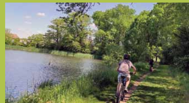
Na hrázi Žižkovského rybníka cestou od místního pivovaru