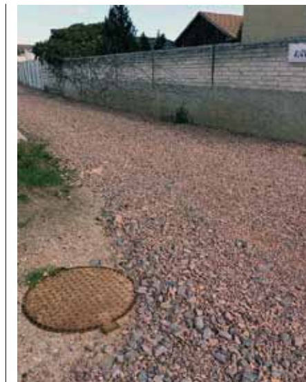
Kanalizace v Uličce v Ladné