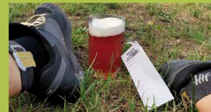
A jedno zasloužené v minipivovaru Na Vyhlídce...