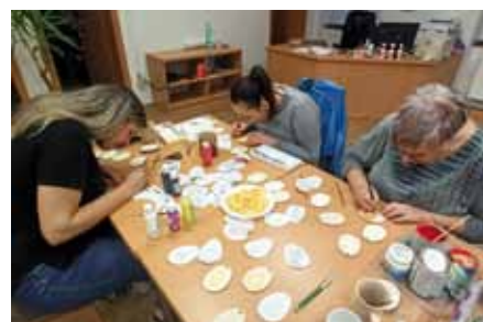
Baby z Jamy zdobí vajíčka z překližky

Letos místní základní škola započala novou masopustní tradici. Nacvičila s chlapci, mezi kterými se ztratila i nějaká ta šikovná dívka, tanec Pod šable. Prošli obcí a na několika zastávkách za zvuků hudby tento tradiční lidový tanec zatančili. Do průvodu se podařilo vytáhnout rodiče s dětmi, mnohé v maskách, a na každém zastavení se vyšli na tanec podívat lidé z okolních domů a ulic. Masopustní průvod končil na Návsi,