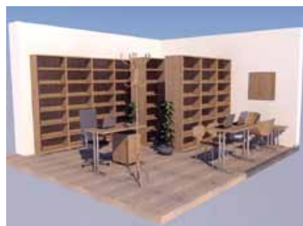
Studie nového vybavení knihovny

Na místním hřbitově jsme nechali odstranit přerostlé túje, které již