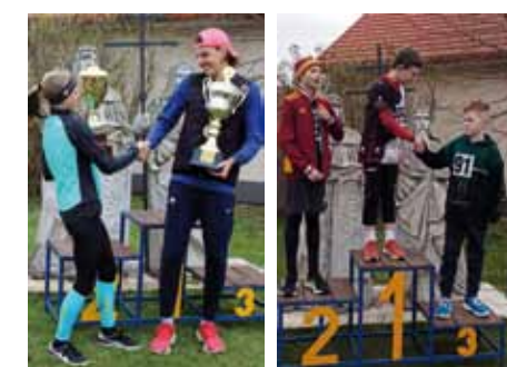
Vlevo nejlepší muž a žena na trati, vpravo vyhlášení kategorie přípravka kluci

Velkomoravský košť vín proběhl také již tradičně odpoledne po silničním běhu. Příjemná atmosféra plného sálu i balkonu kulturního domu, živá hudba prostřednictvím cimbálové muziky Zádruha a všudy-