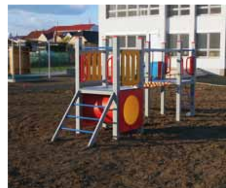
Herní prvky v zahradě her