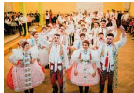
Krojový ples se vydařil

Tradice krojových plesů se objevuje po II. světové válce, jako jedna ze snah o zachování kroje, který se začíná z našich vesnic vytrácet. V některých obcích se staly každoroční tradicí, ale u nás se uskutečnily pouze v roce 1984 a 1999. Letos, po čtyřicetileté pauze, se naše chasa rozhodla takový druh zábavy připravit pro sebe a občany.