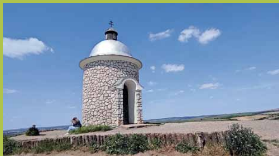
Kaple sv. Cyrila a Metoděje, Václava a Urbana, zvaná také Hradištěk

„Odjakživa si nás dobírali za to, že jako jediní v okolí máme slípku a ne slépku či slepici, jako jinde,“ říkají sami místní vinnáři a dodávají: „Slíпка nás vždy vrací zpět k půdě, k naší vinici a k domovu. K tomu, proč jsme tady, a co si máme chránit.“ A tak si spolek Velkobílovických vinnářů dal slípku