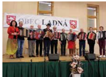
Setkání harmonikářů v Ladné

Sdružení občanů Ladné přichystalo již tradiční úklidovou akci Uklidme Ladnou. Letos se konala 15. 4. 2023. Dobrovolníci procházejí lokality v okolí obce a sbírají odpadky a na závěr je pro všechny přítomné připraven táborák s tradičním opékáním špekáčků.