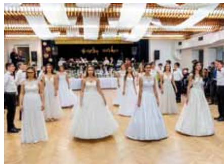
Slavnostní předtančení na Obecním plesu

Velkou novinkou plesové sezóny byl první ročník Obecního plesu, který se uskutečnil v sobotu 21. ledna. Byl zahájen slavnostním předtančným polonézou v podání žáků nejvyšších ročníků základní školy, které se v obci už dlouhá léta nekonalo. Pak už se na parketě střídaly polky a valčíky v podání dechové hudby Zlatulka s mnoha známými populárními písněmi v podání kapely 2+1 Band. Žižkov hostil také 18. ples Regionu Podluží, který se po dvou odkladech uskutečnil 27. ledna. K tan-