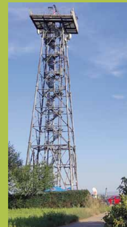
Rozhledna „Na Podluží“

nezastavit ještě třeba v malém pivovaru v Moravském Žižkově, třeba na jednoho Divočáka. Energie z tohoto pivního iontáku se bude hodit při dnešním nejvyšším stoupání k rozhledně u Nového Poddvorova. Rozhledna „Na Podluží“ vznikla v rámci projektu „Turistické rozhledny Podluží - Cerová“, programu příhraniční spolupráce Česka a Slovenska. Otevřena byla v roce 2010, leží v nadmořské výšce 261 m, celková výška stavby je 30 m a na vyhlídkovou plošinu vede 160 schodů. Je volně přístupná a nabízí výhledy na rakouské příhraničí, Malé Karpaty, slovenskou i českou část Bílých Karpat, Chřiby, Pálavu, Lednicko-Valtický areál či Dolnomoravský úval.