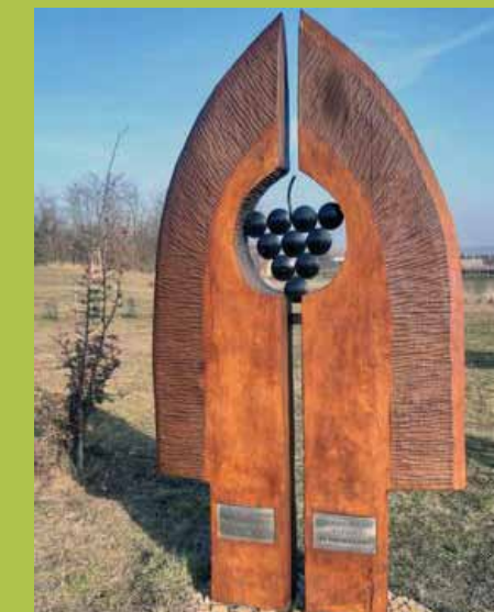
Památník odrůdě Cabernet Moravia, kterou vyšlechtil Lubomír Glos z Mor. Nové Vsi

Celá trasa má asi 45 km s celkovým převýšením 323 m. Trasa je vhodná pro všechny typy kol, které zvládnou terénní cesty. Pro menší děti bude trasa asi náročnější, ale když se za Prechovem dáte doprava rovnou do Moravského Žižkova, zkrátíte si to na 30 km s převýšením 190 m.