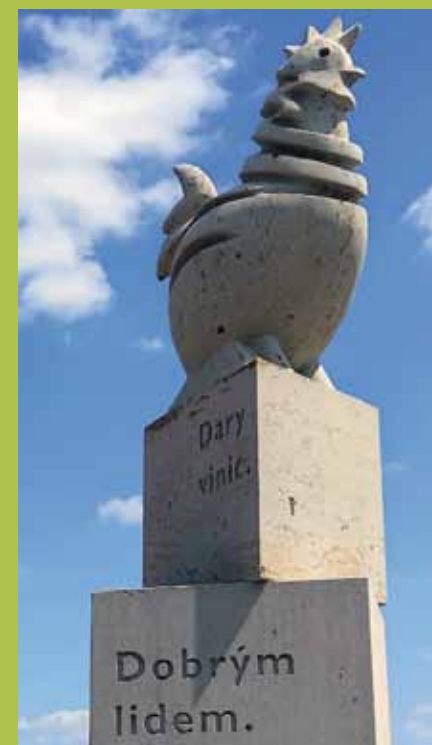
Pískovcová socha slípku u Velkých Bílovic

i do svého loga a postavil jí sochu uprostřed vinic.