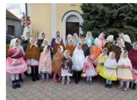
Děvčata před obchůzkou na Smrtnici

Po dlouhých dvou letech, kdy nám covidové šílenství bránilo setkávat se s kamarády, přáteli či známými, jsme se mohli setkat na skvělém tradičním pyžamovém plese dobrovolných hasičů v Josefově. Účastníci si přišli na své, vynikající DJ navodil neskutečně skvělou atmosféru, taneční parket byl neustále zaplněn až do ranních hodin. „Ještěže se nemusím svlékat až přijdu domů, mám pyžamo, jdu rovnou do postele. Za měsíc jsme