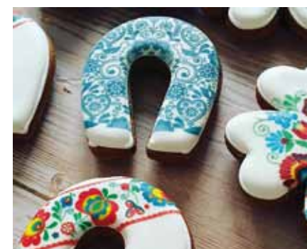
Perníčky s ornamenty od Mlsné kočičky

zaměřuje na tradice, ale každá trochu jinak. Zatímco Tradiční výrobek Slovácka uděluje značku výrobcům využívajícím skutečně etnograficky doložené tradiční techniky, novější regionální produkt myslí na ostatní šikovné řemeslníky, kteří už tradiční techniky nebo lidové vzory využívají moderními způsoby. Značku SLOVÁCKO regionální produkt provozuje Turistická asociace Slovácko, značku Tradiční výrobek Slovácka provozuje Region Slovácko – sdružení pro rozvoj cestovního ruchu.