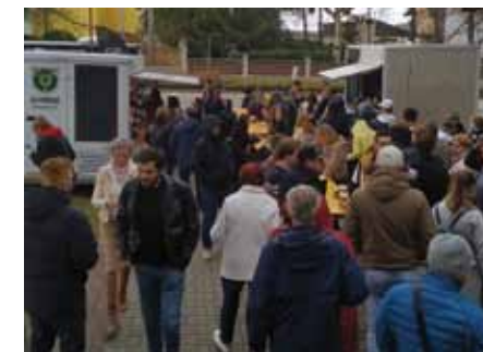
Nákladáčky s jídlem zavítaly do Prušánek

Spolek Mladí pro Prušánky letos na apríl uspořádal již potřetí akci zvanou FOOD & Market. Název může působit cizácky, ale každý, kdo má rád jídlo, tak slovo „food“ vždy rád uvidí. A že „mark(e)t“ je trh, to věděly už naše babičky. Tentokrát měl FOOD & Market přídomek „velikonoční“, a tak nebyla nouze o velikonoční program. Dílničky pro děti nabízely možnost vytvořit si řadu různých dekorací a chlapcům šanci včas připravit „žilu“. To hlavní však číhalo už před vchodem do kulturního domu, a to stánky se skvělým jídlem a pitím. K dispozici byly čtyři mezinárodní kuchyně. Vietnamská nabídla tradiční závitky či populární Bún bò Nam Bò, americký stánek připravil vynikající hambur-