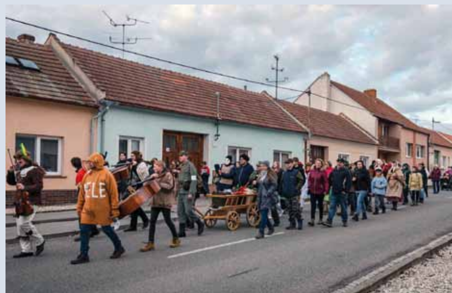
Záběr z fašaňkového průvodu v Moravském Žižkově

Jsem rád, že je obec Moravský Žižkov členem dobrovolného svazku obcí Regionu Podluží. Považuji tento subjekt za smysluplný a pro všechny přínosný. Starostům a zastupitelům členských obcí bych rád vyjádřil své poděkování za práci, kterou odvádí pro region nad rámec hranic katastrů svých obcí. Přeji vám všem, Podlužáci, hodně zdraví, štěstí a klidu do dalších let.