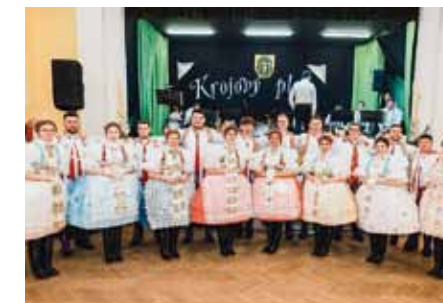
Krojový ples ve Starém Poddvorově

Tradicí na krojových plesích jsou besedy, letos to byla Moravská beseda. Naše chasa připravila dvě kolečka, tedy osm párů, po jednom kolečku přijeli tanečníci z Čejkovic, Prušánek, Hovorán a Moravské Nové Vsi. Parket hýřil nejen kroji Podluží ale i Kyjovska a Hanáckého Slovácka.