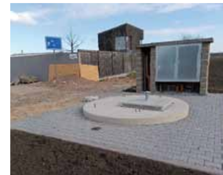
Přečerpávací stanice na ulici Ovčáčky